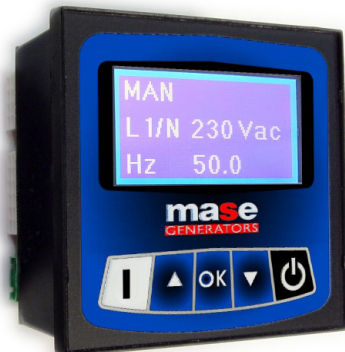
LOGICA DI CONTROLLO