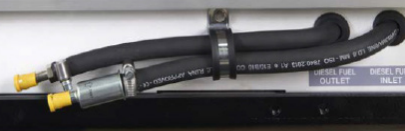
TUBO CARBURANTE ANDATA/RITORNO

L'intercooler W/A consente di svincolare completamente il gruppo elettrogeno dalle condizioni ambientali esterne, permettendo all'alternatore e al motore di lavorare a temperatura ideale ottimizzando il rendimento e l'affidabilità della macchina.