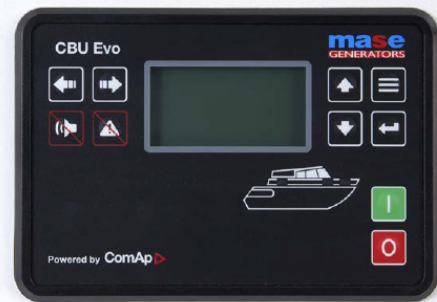
LOGICA DI CONTROLLO