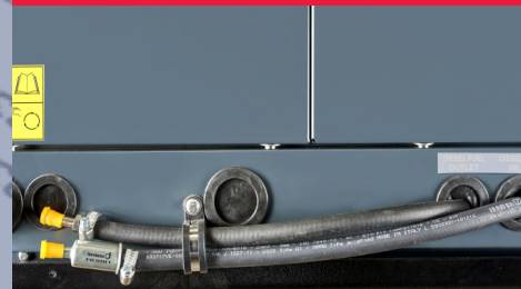
TUBO CARBURANTE ANDATA/RITORNO

I giri del motore variano a seconda del carico richiesto; quindi, se si hanno poche applicazioni elettriche collegate, il generatore si calibrerà automaticamente alla potenza richiesta, garantendo al contempo un'eccezionale stabilità di tensione e frequenza. Questo significa minore consumo, riduzione delle emissioni, minore manutenzione e maggiore silenziosità. Estremamente compatto e silenzioso, il generatore è equipaggiato di un doppio sistema antivibrante per incrementare il comfort: il primo riduce il livello di vibrazioni provenienti dal gruppo motore/alternatore verso il telaio, il secondo assorbe le microvibrazioni residue originate tra il telaio del generatore e la barca.